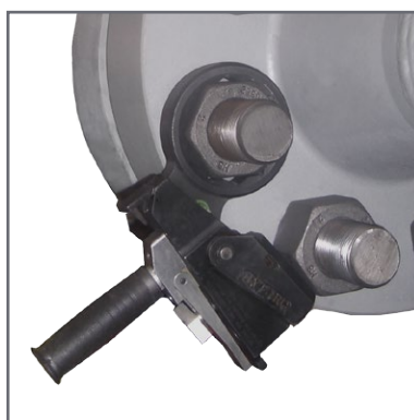
De tegenhoudsleutel is voorzien van een ergonomisch handvat waardoor deze eenvoudig te plaatsen is.