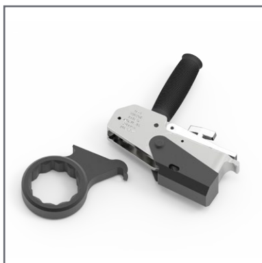
Les tailles différentes sont remplacées simplement et rapidement.